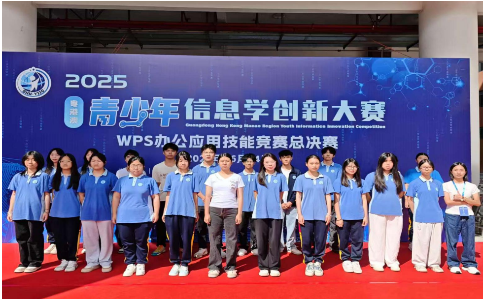
图 37 我校学生参加 2025 年 WPS 办公应用技能竞赛全国总决赛