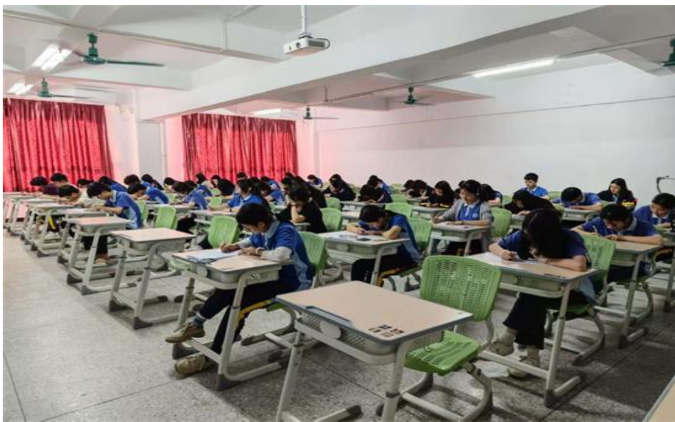
图 14 硬笔书法比赛现场

描绘出雷锋精神在当代传承的动人画卷。硬笔书法比赛现场，同学们神情专注，钢笔、签字笔在纸上灵动游走，楷书端正规整、行书流畅自然、隶书古朴典雅，规范美观的字体既展现了扎实的书写功底，也传递着对雷锋精神的深刻诠释。演讲比赛中，选手们自信昂扬，从雷锋的光辉事迹切入，回顾精神传承脉络，结合自身经历与身边案例，深入阐述雷锋精神的时代价值，用富有感染力的语言呼吁大家践行雷锋精神，让其在新时代绽放新光彩。