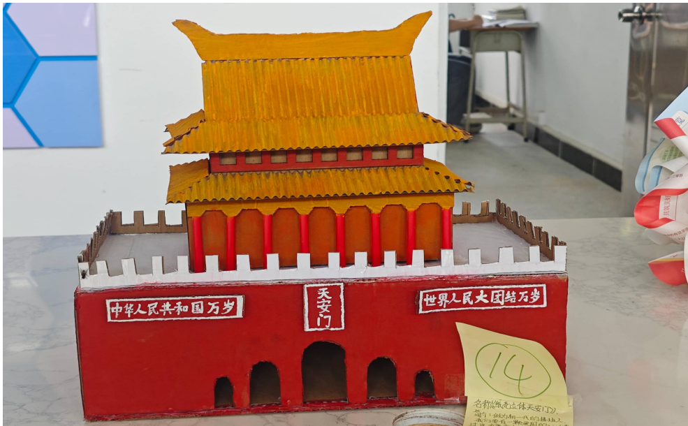
图 43 学生利用旧纸盒制作天安门