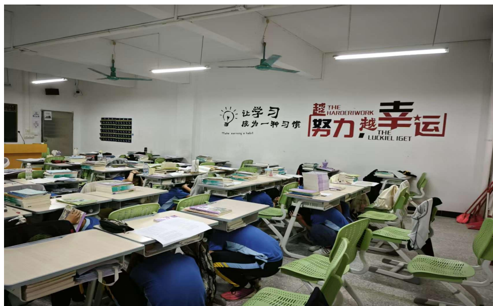
图 30 学生进行防灾减灾应急演练

我校坚持应急演练常态化，定期开展消防演练、地震应急演练，累计参与学生 3000 余人次。通过实战化演练，让学生熟练掌握应急疏散路线、自救互救技巧，有效提升应对突发安全事件的反应能力与处置能力，筑牢校园安全“防火墙”。