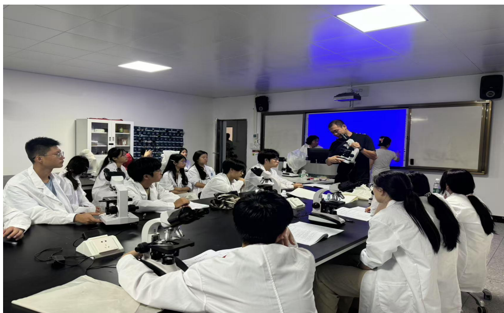
图 39 生物技能证书培训