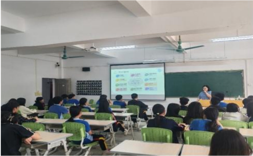
图 26 班长、副班长心理专题培训课堂现场