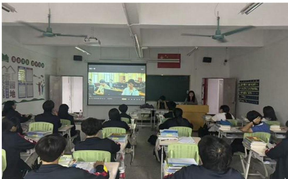
图 29 学生观看反诈题材电影《孤注一掷》