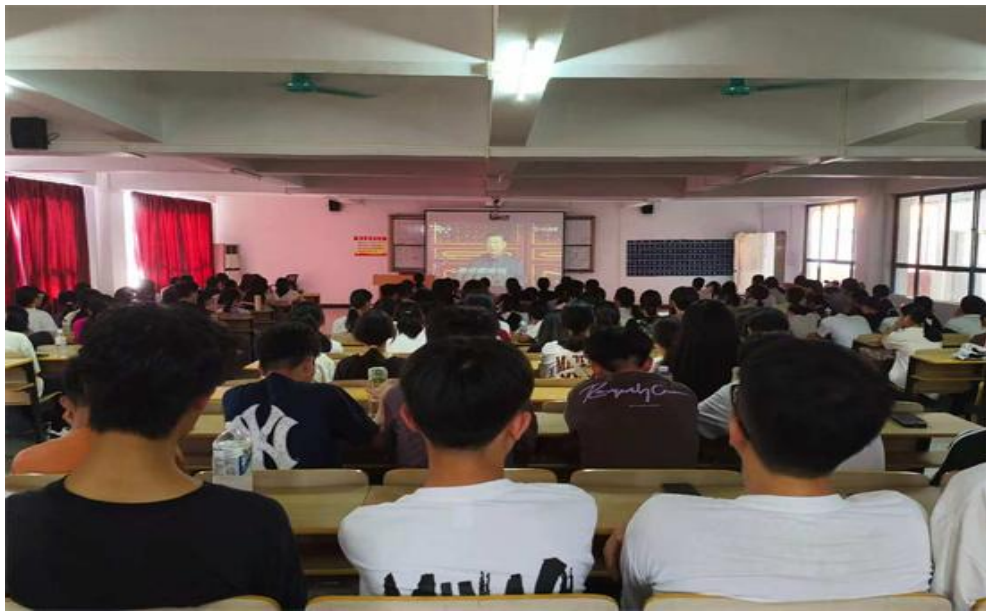
图 11 我校组织全校师生集体观看九三阅兵仪式

毛泽东思想、邓小平理论、“三个代表”重要思想、科学发展观，全面贯彻新时代中国特色社会主义思想，坚定不移走中国特色社会主义道路，传承和弘扬伟大抗战精神，踔厉奋发、勇毅前行，为以中国式现代化全面推进强国建设、民族复兴伟业而团结奋斗。师生们备受鼓舞，纷纷表示要将抗战精神转化为学习工作的强大动力，为国家发展贡献力量。