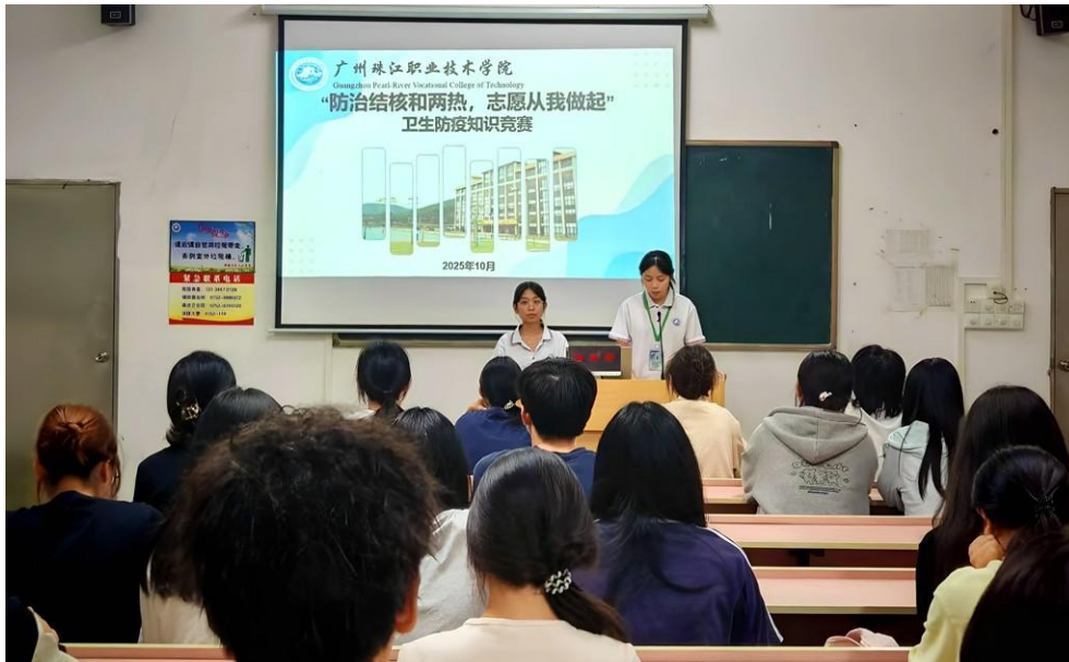
图 54 防范基孔肯雅热登革热等传染性疾病主题班会