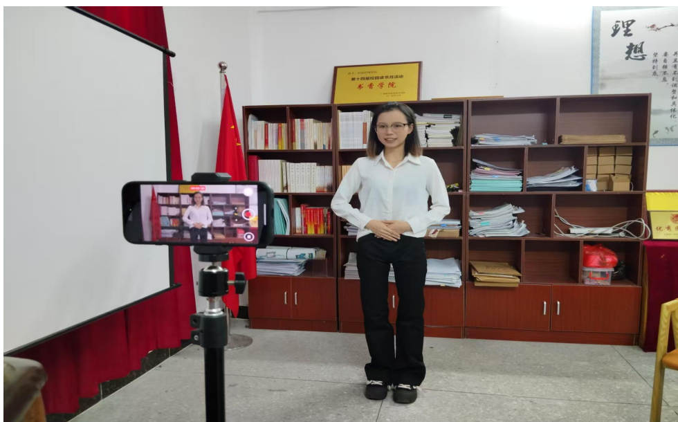
图 46 学生正在录制广东省中华经典诵写讲大赛视频