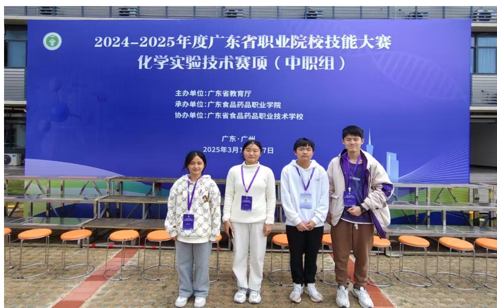
图 35 我校学生参加 2025 年广东省职业院校技能大赛化学实验技术赛项