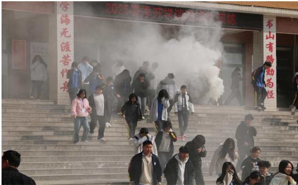
图 31 同学们用湿毛巾或衣袖捂住口鼻，弯腰低身，转移安全地带