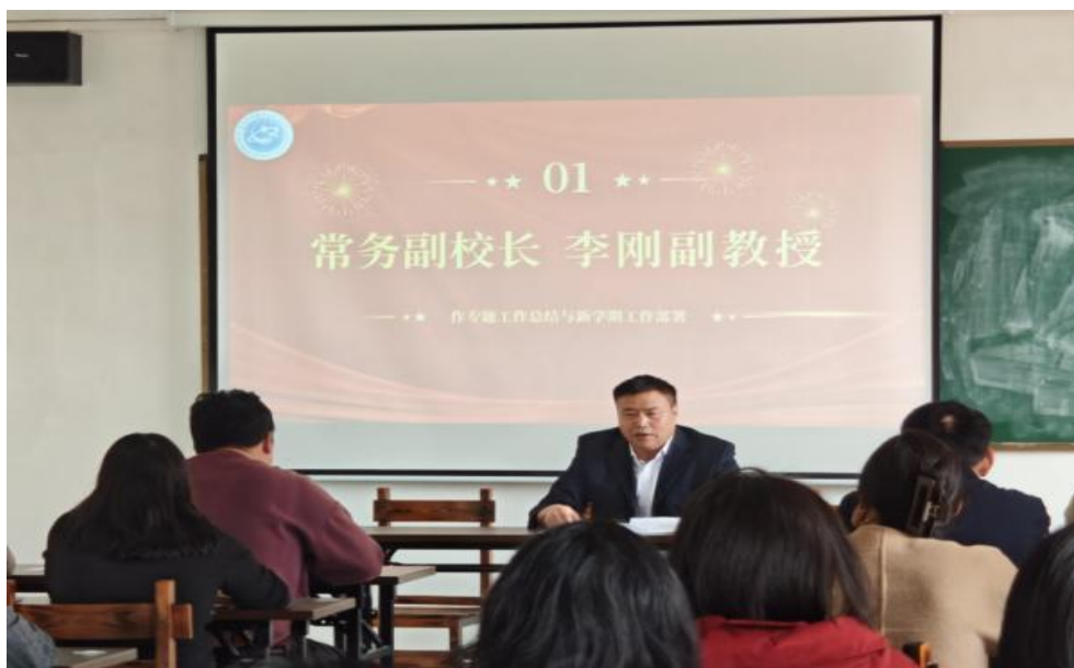
图 17 学生管理工作会议现场照片

此外，我校高度重视班主任能力提升，组织班主任参与心理健康教育专题网络培训、学校心理中心专项培训、班主任素质能力大赛观摩、师德师风培训会等多项学习活动，全方位赋能班主任专业成长。