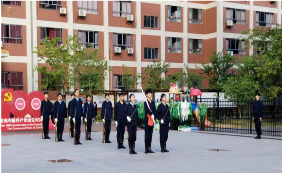
图2 校仪仗队正准备升旗