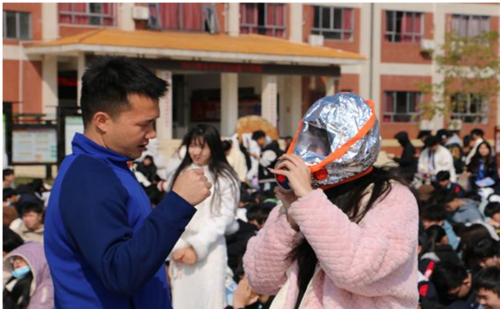
图 32 学生试戴防毒面具