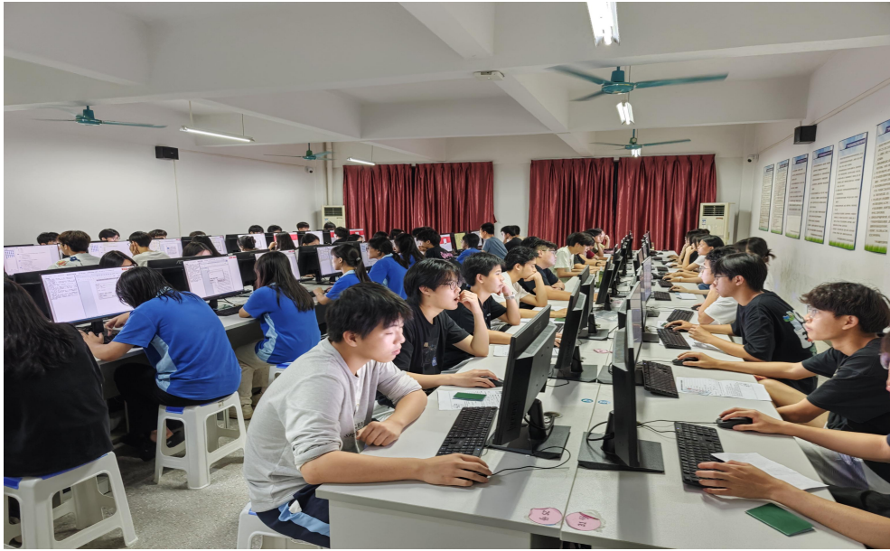
图 40 全国计算机技能证书培训