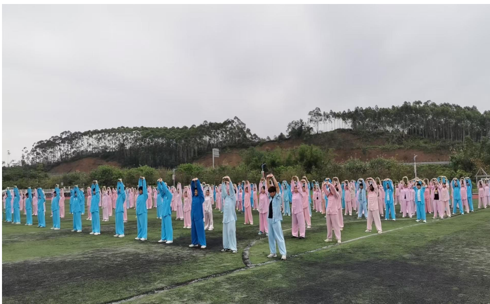
图 47 学生在练习太极拳

一系列丰富多彩的传统文化活动，让校园充盈着浓厚的文化氛围，使学生在耳濡目染中接受传统文化熏陶。学校相关负责人表示，未来将持续深化传统文化教育，丰富活动形式、拓宽实践路径，让优秀传统文化在校园落地生根、开花结果，为培养兼具深厚文化底蕴与全面素养的新时代人才筑牢根基。