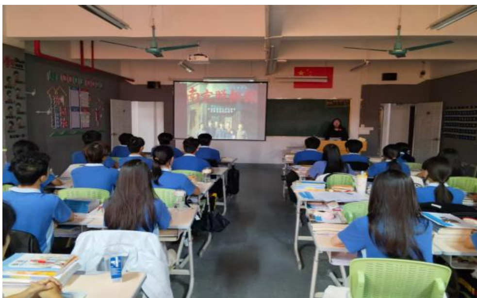
图 10 学生在观看爱国教育题材电影

为传承红色基因，厚植爱国主义情怀，各年级班级不定期组织学生观看爱国红色电影。影片中革命先辈为国家独立、民族解放而浴血奋战的事迹，让学生深刻感悟历史使命，明白新时代青年肩负着实现中华民族伟大复兴的重任，从而坚定铭记历史、缅怀先烈、砥砺前行的信念，自觉锤炼品德修养、勤学科学文化知识，立志为祖国繁荣昌盛贡献青春力量。