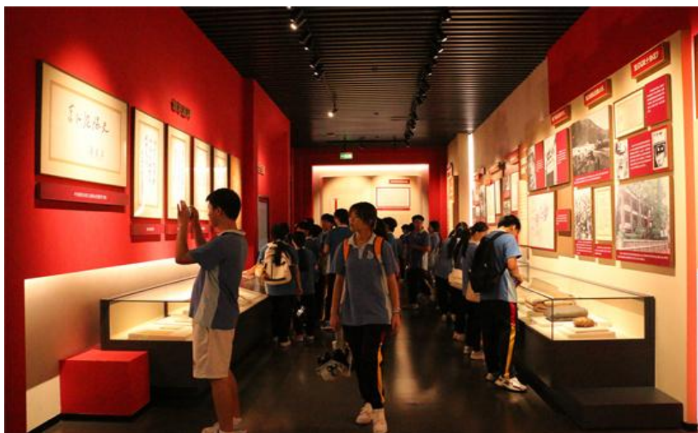
图 13 我校组织学生参观东江纵队纪念馆