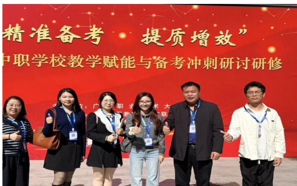
图 38 我校教师参加 2025 年广东省中职学校教学赋能与备考冲刺研讨研修会

参加“精准备考，提质增效”广东省中职学校教学赋能与备考冲刺研讨研修。我校参训人员全程沉浸式参与各项议程，深入学习中职教育政策导向、教学管理创新路径及语数英等学科精准备考技巧，积极与省内外同行交流办学经验与备考心得。此次研修有效拓宽了教学改革视野，厘清了备考工作重点，后续学校将梳理吸收研修成果，融入教学管理与备考实践，优化课程设计、强化教学实效，为学生冲刺2026年职教高考筑牢基础。