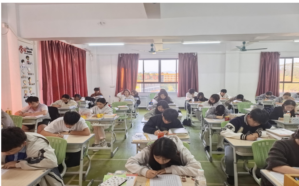
图 48 学生在练习书法