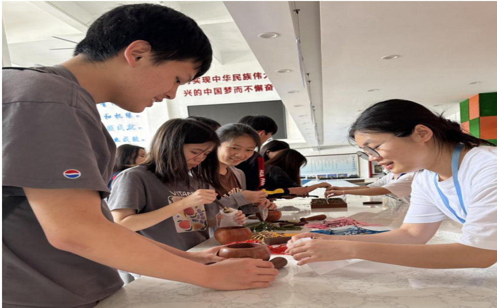
图 27 “一缕浅香，心绪安宁”心理香囊制作活动现场