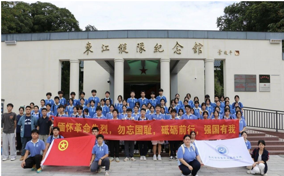
图 45 我校师生前往广东东江纵队纪念馆研学