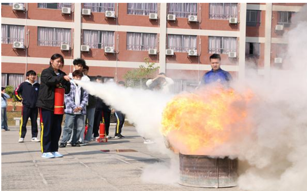
图 33 学生正确使用灭火器