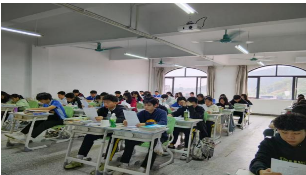
图9 学生们正在进行“宪法晨读”活动

为全面学习贯彻党的二十大精神与习近平法治思想，推动青少年宪法宣传教育常态化、长效化，我校开展“学宪法，讲宪法”系列专项活动。通过“宪法晨读”“学宪法讲宪法”主题班会、宪法知识竞赛等丰富形式，向学生普及宪法知识、弘扬宪法精神，培育宪法法治观念，引导学生树立正确的权利义务观，助力学生健康成长、全面发展。