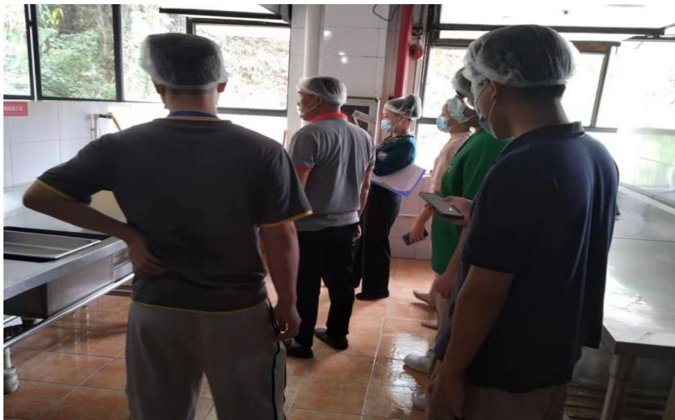
图 56 上级领导检查食堂卫生

即现场进行解决，目前，学校食堂卫生符合食品卫生管理要求，饭菜价格适中、味道可口，基本满足校内学生用餐需求。