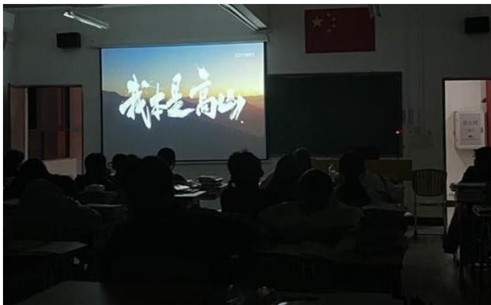
图 7 学生观看电影《我本是高山》