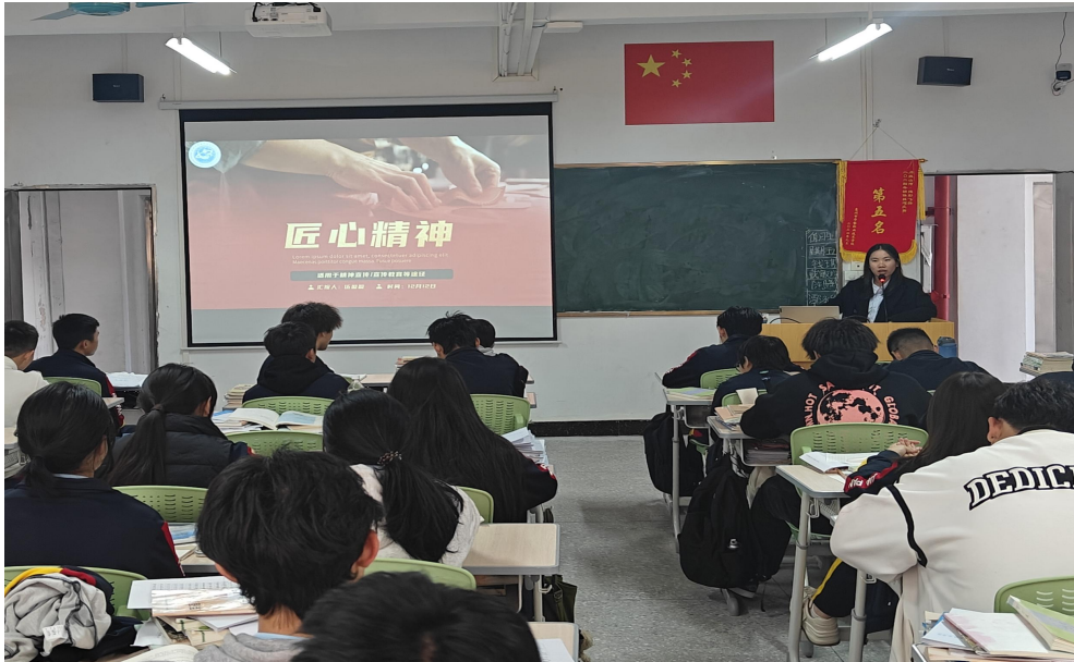
图 42 班主任老师正在为同学们讲述工匠精神