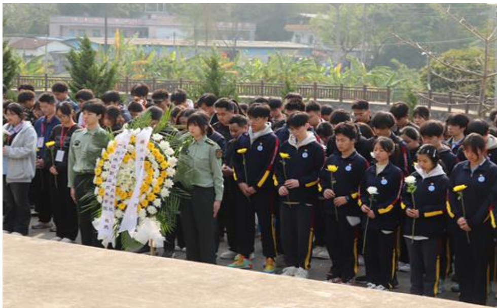
图 12 我校师生前往蒲芦飞英雄村进行祭扫活动