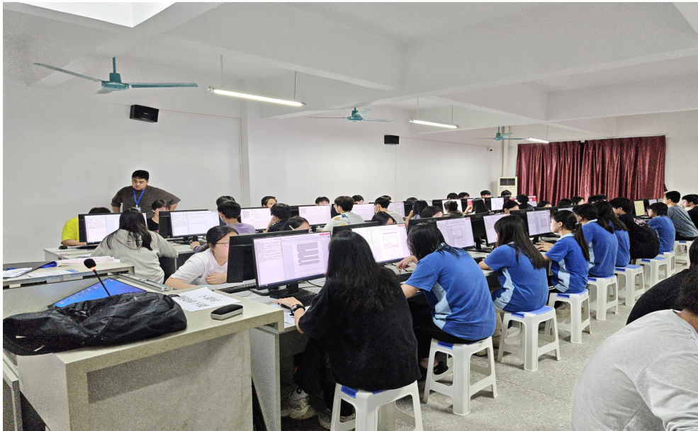
图 41 1+X (wps) 技能证书培训