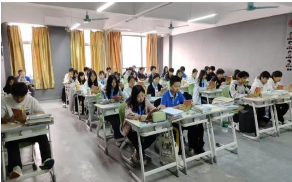
图4 学生在诵读《弟子规》