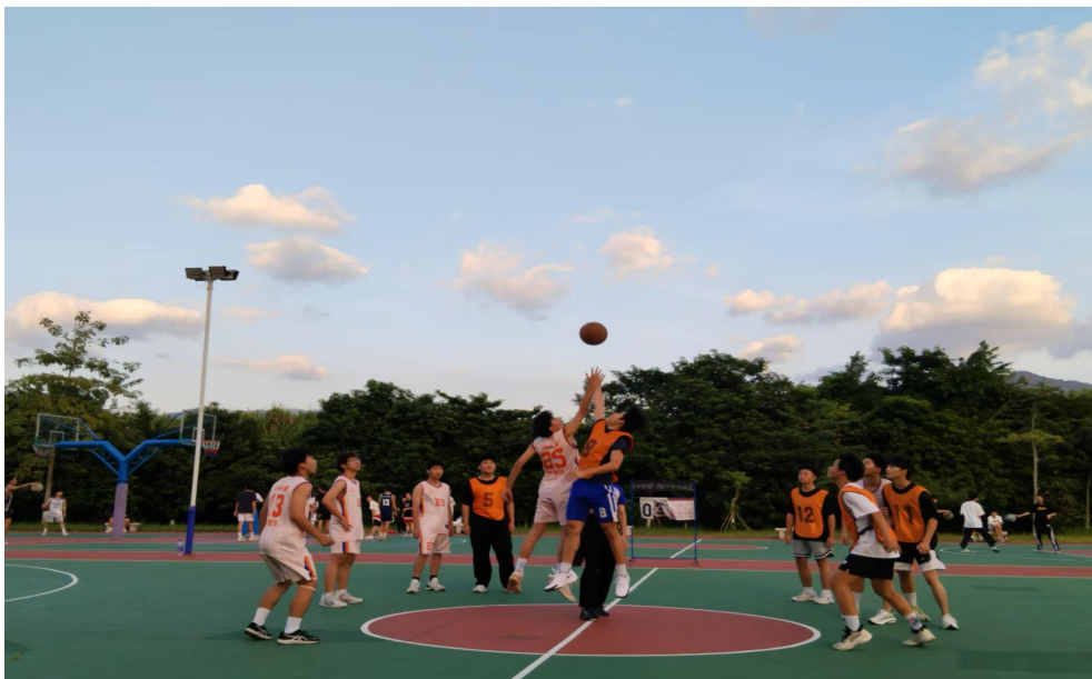
图 22 篮球赛精彩瞬间

赛事规则精心设计，男子组采用小组赛单循环结合复赛交叉淘汰制，经过层层角逐决出八强；女子组依据循环赛积分排名，前四名晋级决赛。此外，赛事还特别设置体育道德风尚奖、最有价值球员(MVP)等多项荣誉，全面表彰表现优异的团队与个人，充分激发学生的参赛热情与竞技潜能。赛场上，选手们奋勇拼搏、默契配合，精彩的传球、投篮、防守赢得现场观众阵阵喝彩，充分展现了职校学子朝气蓬勃、永不言弃的青春风貌。