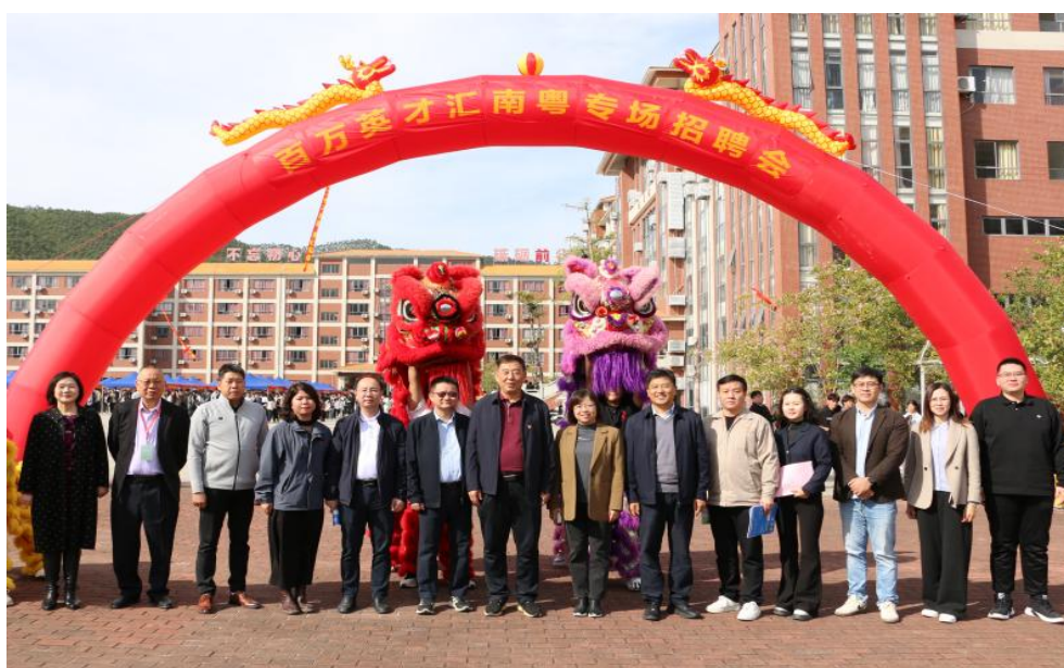
图 51 百万英才汇南粤专场招聘会

惠州市华磐职业技术学校始终聚焦中职学子的成长需求，以产教融合为纽带，搭建多元实践平台，助力学子提前衔接职场、明晰发展方向。