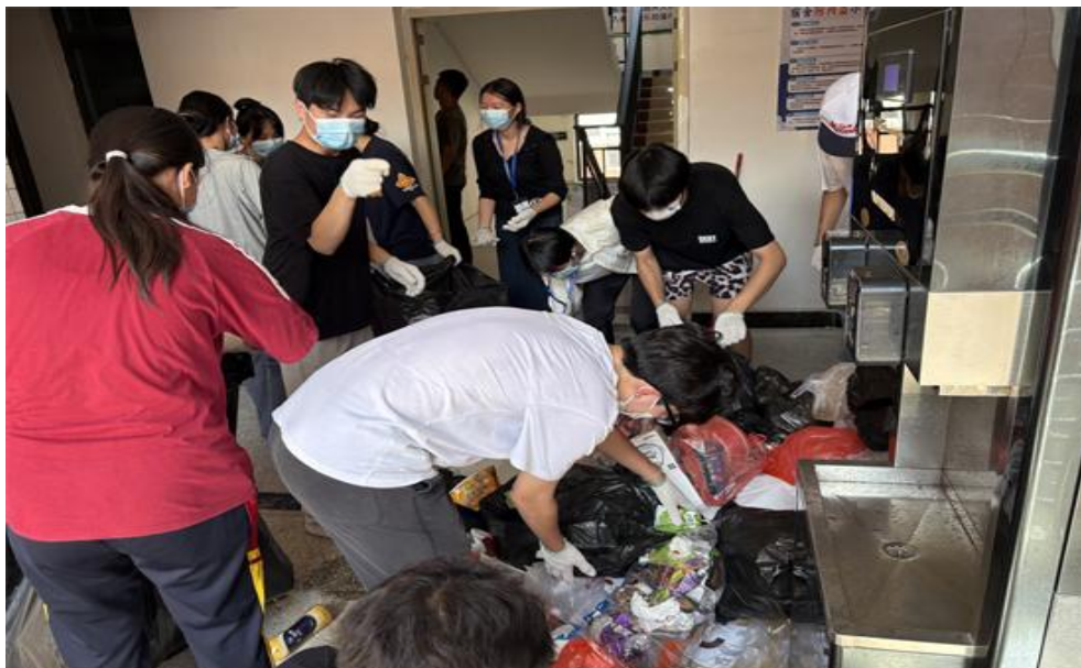
图 16 我校学生志愿者开展宿舍楼道清扫活动