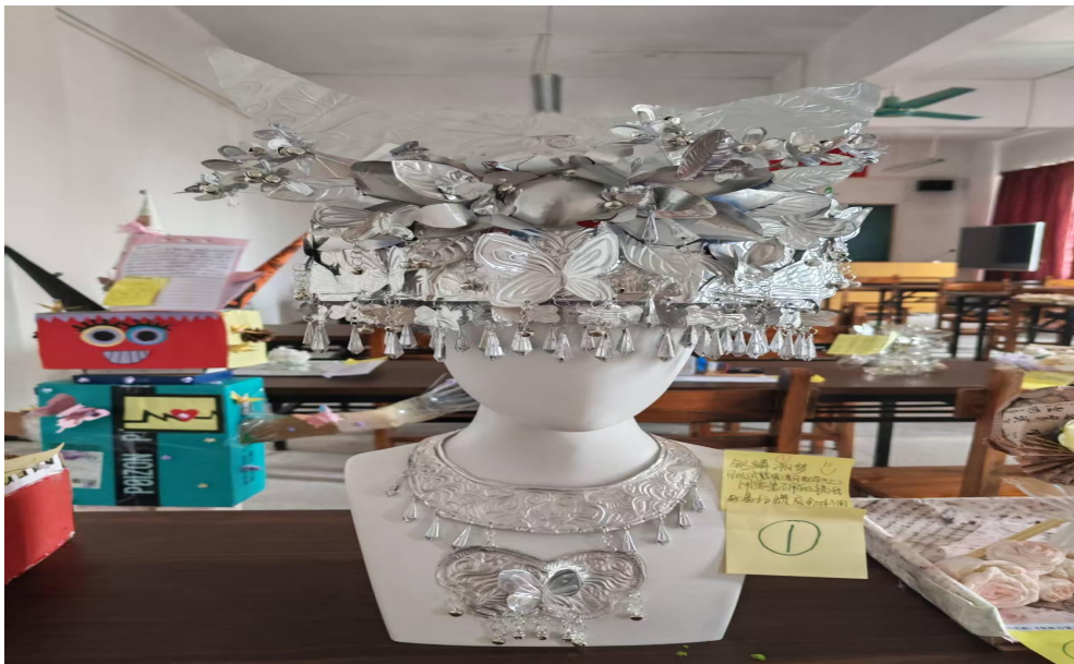
图 44 学生用废旧材料复刻苗族银饰，钻研工艺细节