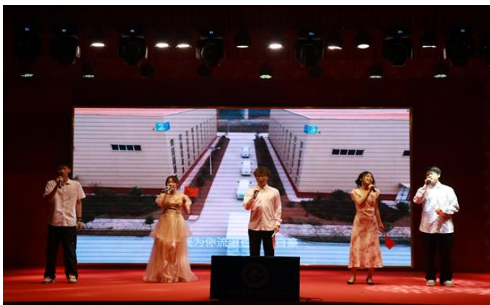
图 20 校园青歌赛现场

切磋球技、展现自我、凝聚团队力量的竞技平台；开展2025年“传承雷锋精神，闪耀青春光芒”主题活动、第二届“心光熠熠，青春同行”心理健康活动，覆盖思想引领、品德培育、心理护航等多个维度；组织学生参加首届罗浮山艾灸保健技能竞赛，凭借扎实的专业技能斩获金铜奖；校园青歌赛为爱好音乐的学生提供了展示才华的舞台，展现了职校学子的青春风采。