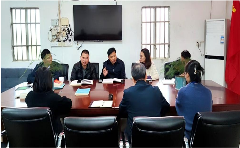
图 57 学校与属地村委部署联防联控工作