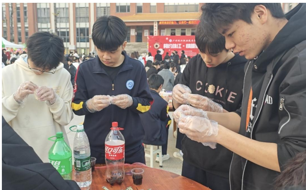
图 50 学生在包饺子