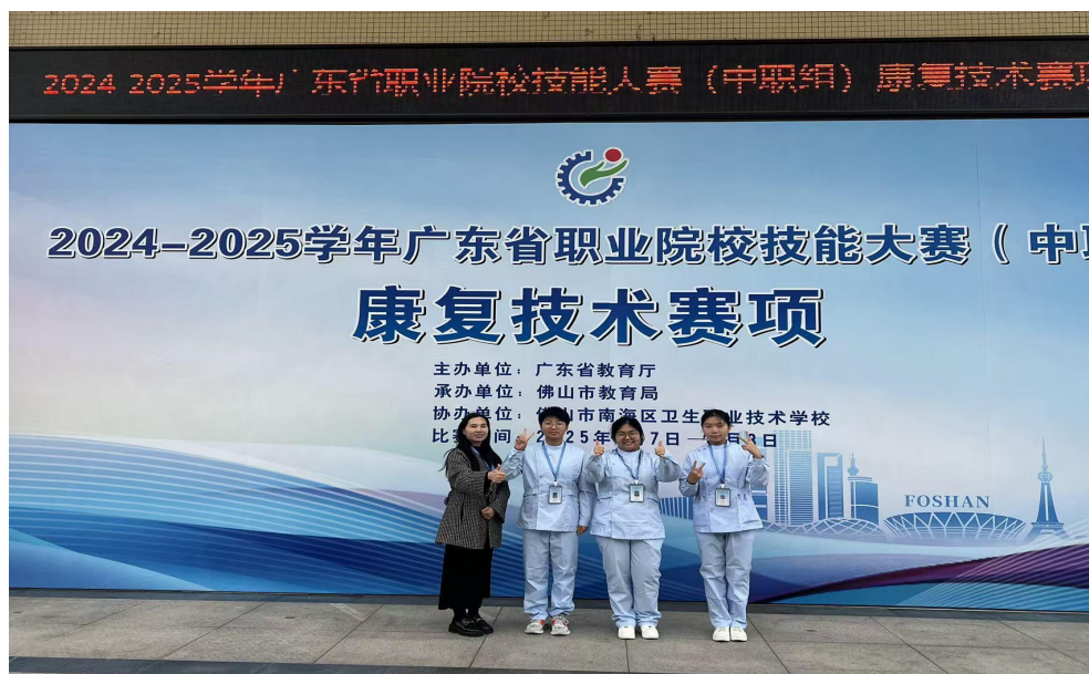
图 34 学生参加 2025 年广东省职业院校技能大赛康复技术赛

力，收获远超奖项本身。赛后，各专业已启动教学反思，计划将竞赛反映的新技术、新规范融入日常教学与实训改革，切实将“以赛促教、以赛促学”的理念转化为持续提升人才培养质量的扎实行动。