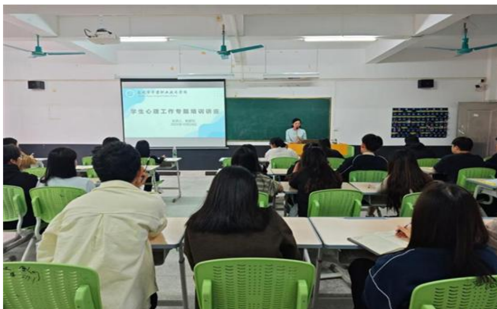
图 25 班主任参加学生心理工作专题培训