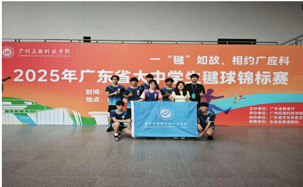
图 23 我校毬球队外出比赛合照