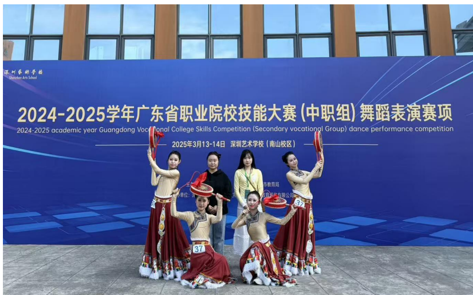
图 36 我校学生参加 2025 年广东省职业院校技能大赛舞蹈表演赛项