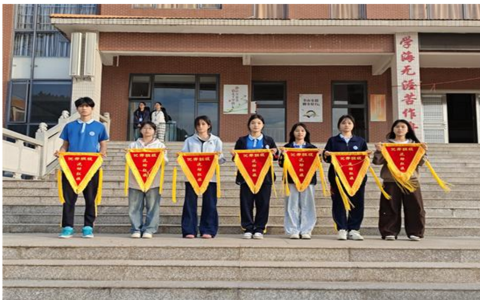
图 19 获得流动红旗班级代表合影

10月以来，我校以流动红旗评选为重要抓手，持续深化班风学风建设。各班级紧扣日常管理、环境整治、学风营造等核心要求，积极行动、全力冲刺，在班级管理、学生行为规范、集体活动参与等方面展现出良好风貌，校园内形成了“班班争先进、人人求进步”的生动局面。