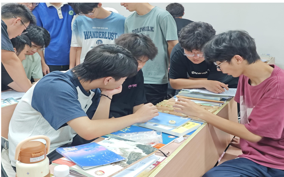
图 49 学生正在下棋