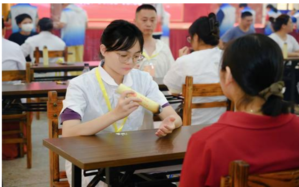
图 21 我校学子参加首届罗浮山艾灸保健技能竞赛