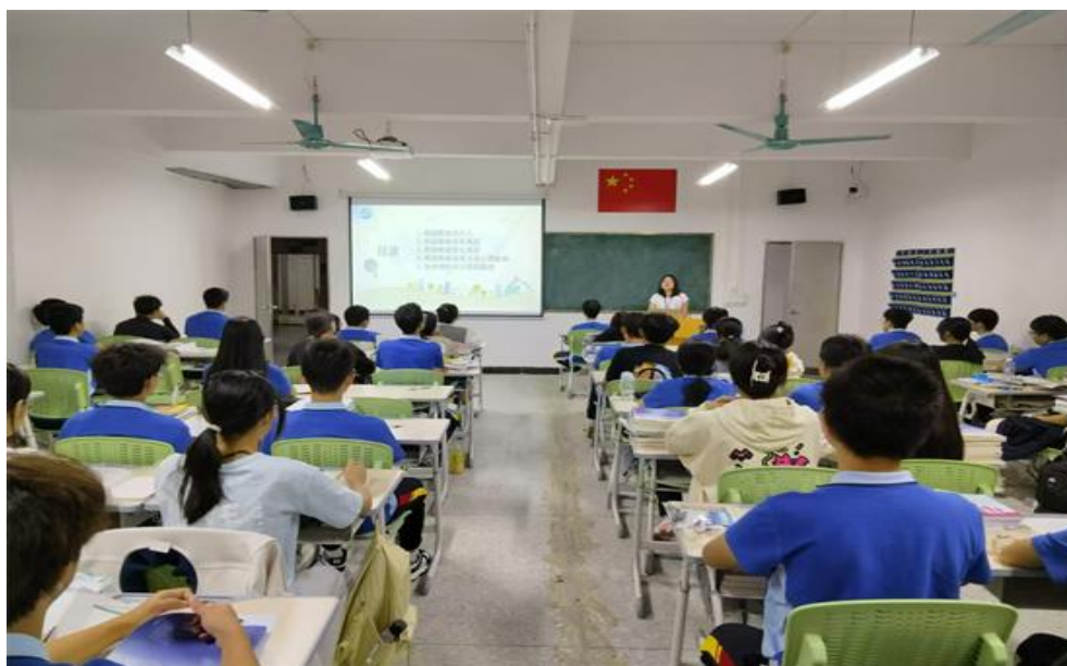
图 28 班主任开展“拒绝校园欺凌”主题班会

开展全方位专项安全宣传，组织学生观看艾滋病、丙肝防治线上宣传讲座，围绕防溺水、交通安全、禁毒、消防安全、宿舍用电安全、食品安全、杜绝高空抛物、防震减灾等主题开展专题班会，通过视频讲解、情景模拟、知识竞赛等多元形式，广泛普及各类安全知识，帮助学生掌握实用的安全防护技能，做到防患于未然。