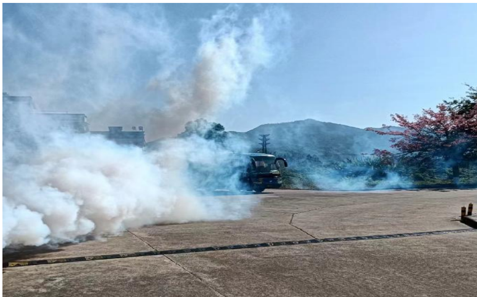
图 55 校园灭蚊消杀